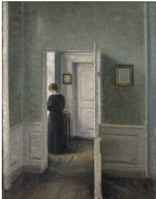
Vilhelm Hammershøi, Intérieur avec une femme debout, Danish Art Collection © TX0006154704, registered March 22, 2005

https://www.pinterest.fr/pin/308778118186731624/